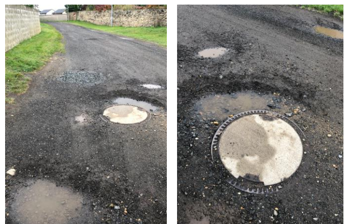
Obr. č. 4 a 5: Cesta Za Humny ve směru od rybníku

Termín začátku obnovy cesty v ulici Za HUMNY je: