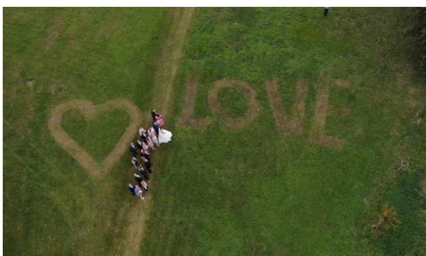
Louka u rybníka: Na počest ženicha a nevěsty vytvořil pan údržbář při sekání trávy milé symboly.