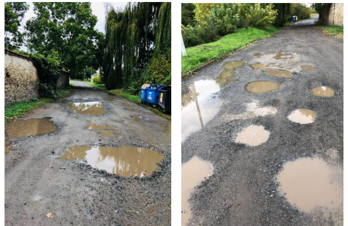
Obrázek č. 1 a 2: Cesta Za Humny ve směru od Hlavní